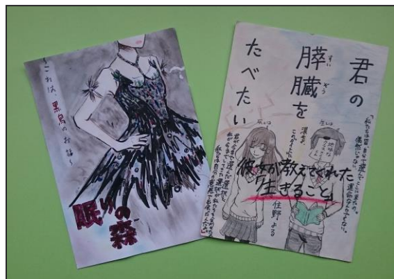
昨年のPOPコンクール1位、2位作品