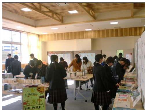
昨年の古本市の様子

古本市の売り上げで、新しい本を購入することができます。ご協力よろしくお願いします!